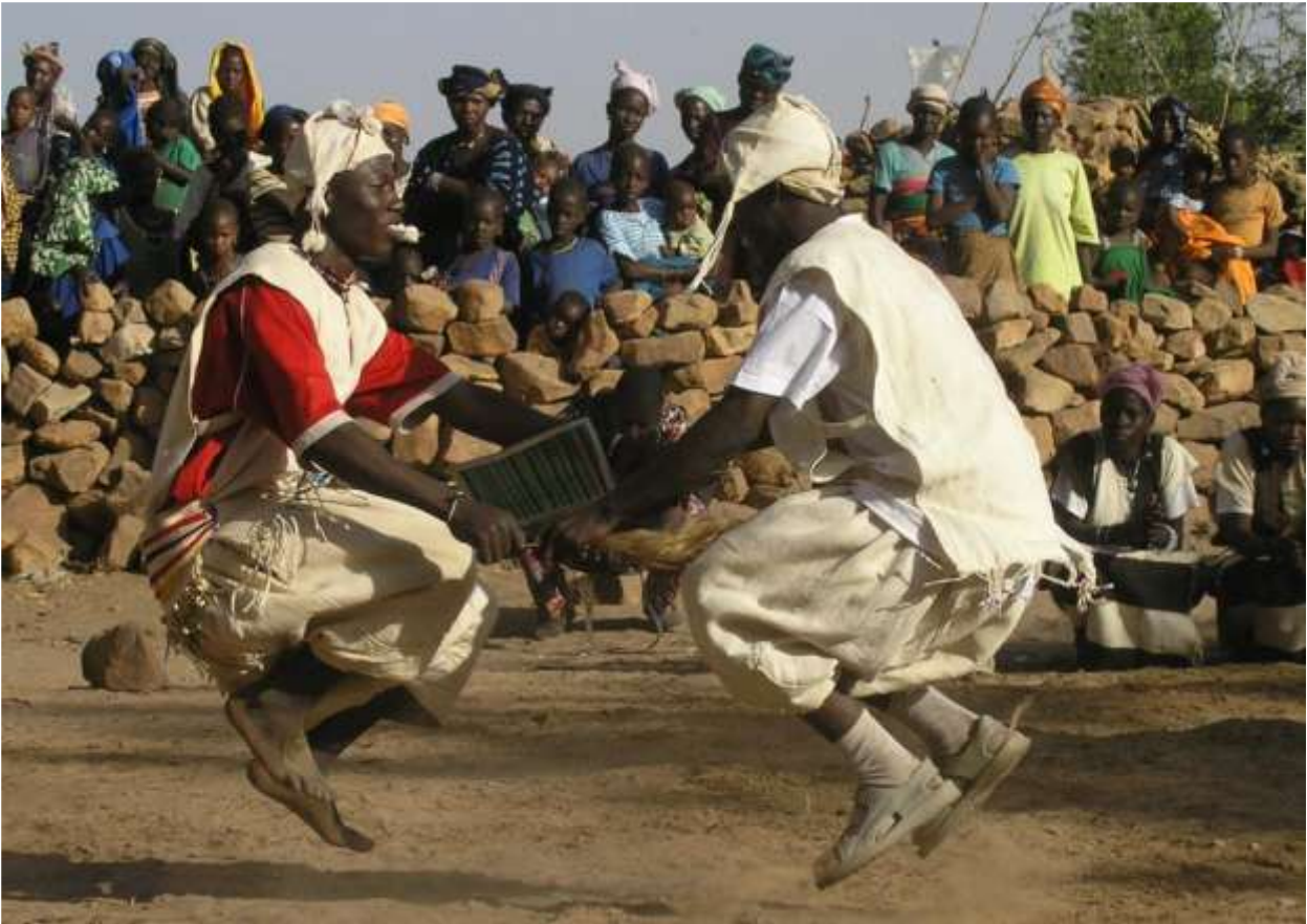
Figure 3: Danse démonstrative au Festival de Nombori, Pays Dogon