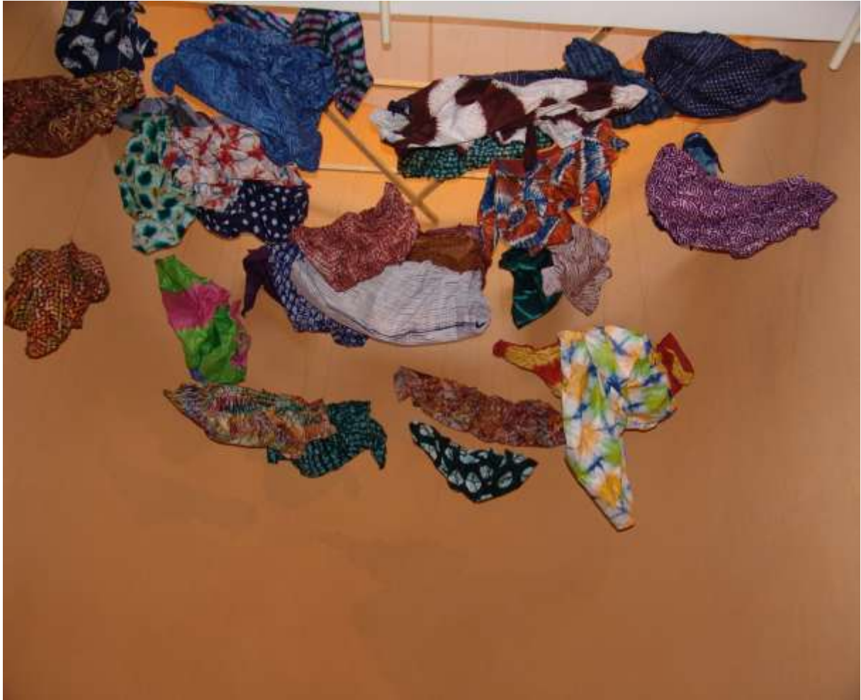
Figure 1: Bazin suspendu dans une salle du Musée National