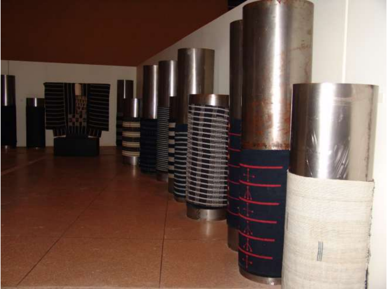
Figure 15: Tissus en indigo enroulés autour des barriques