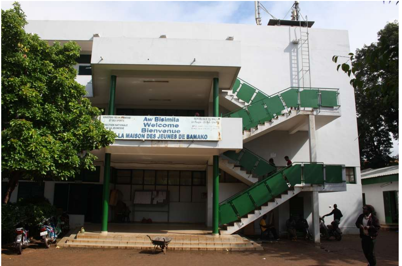
Figure 9: Maison des Jeunes de Bamako