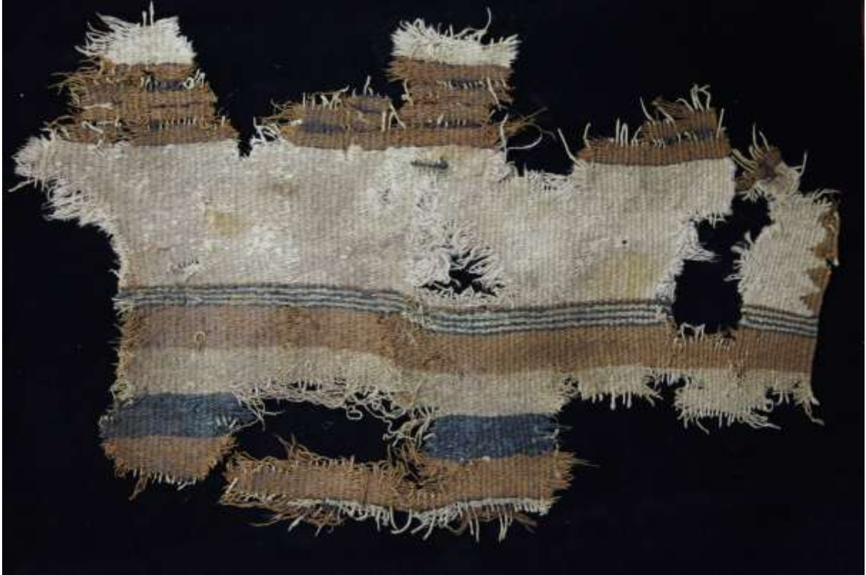
Figure 2: Tissu tellem entre les 11 ème et 16 ème siècles