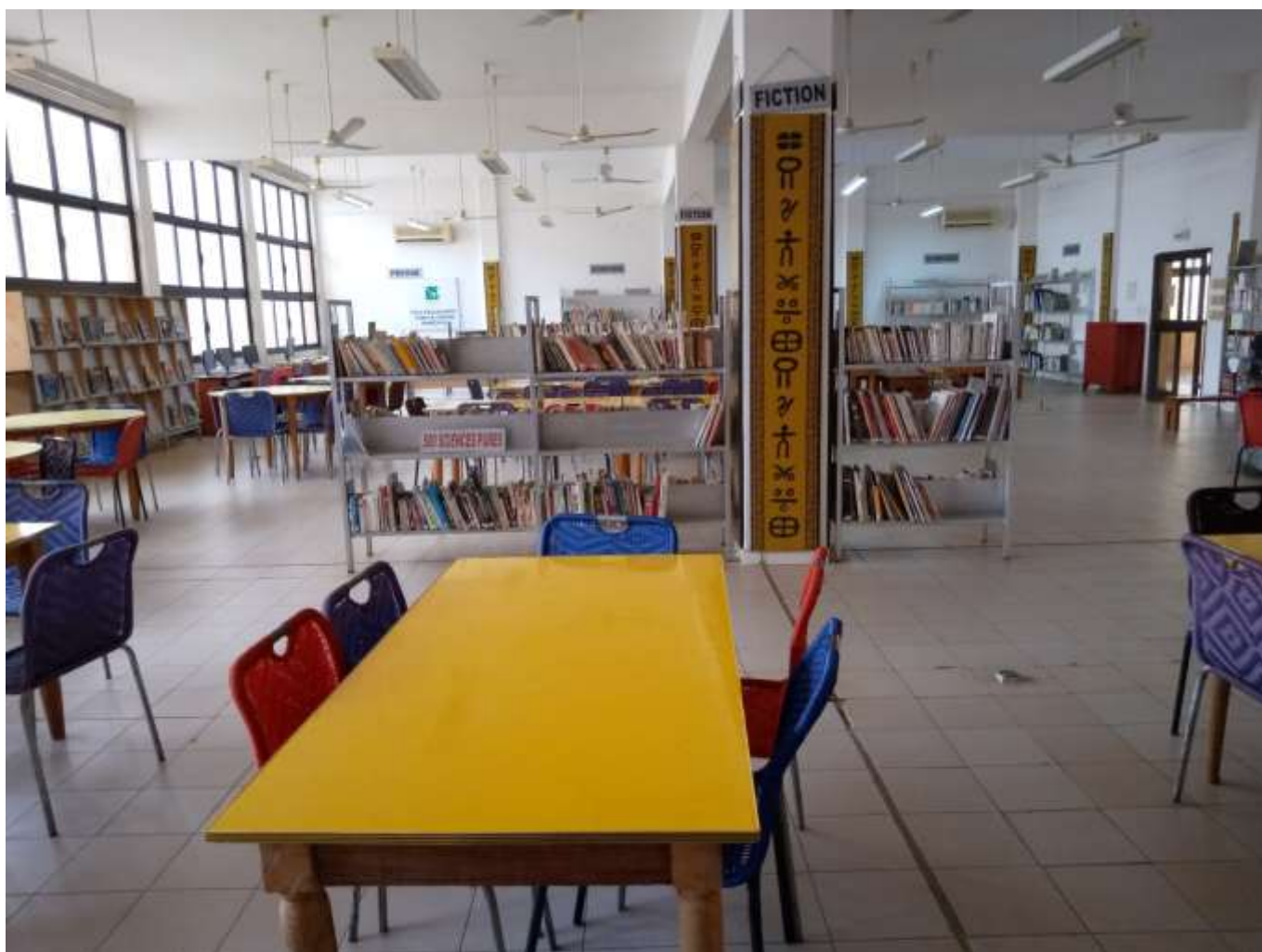
Figure 5: Salle de lecture pour adulte du Centre National de Lecture Publique