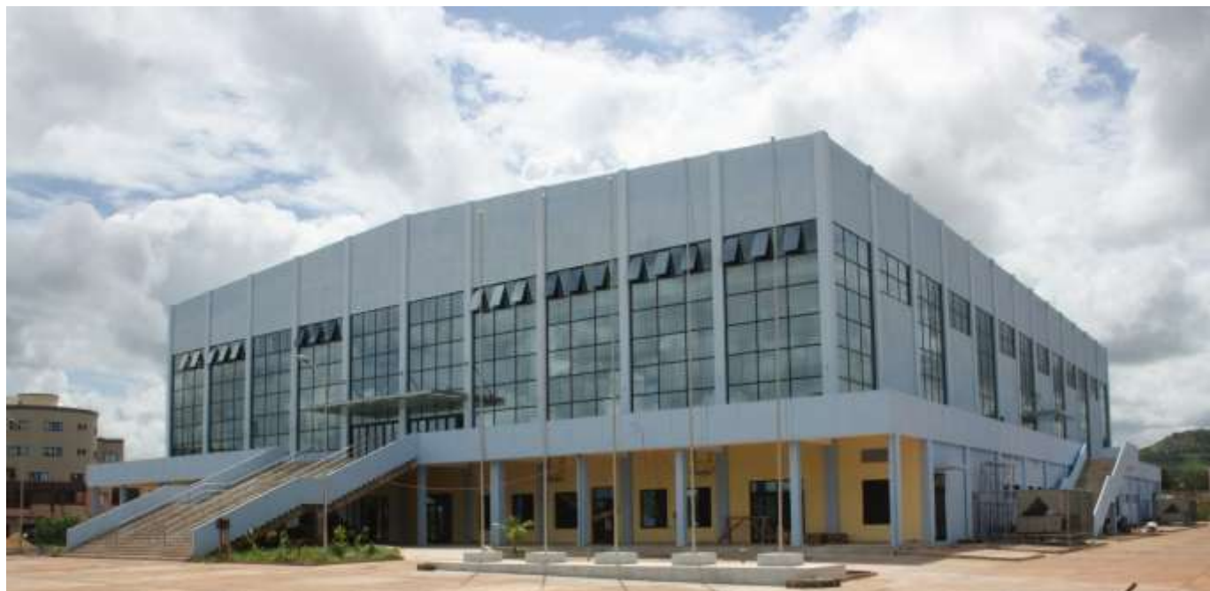
Figure 10: Palais des Sports