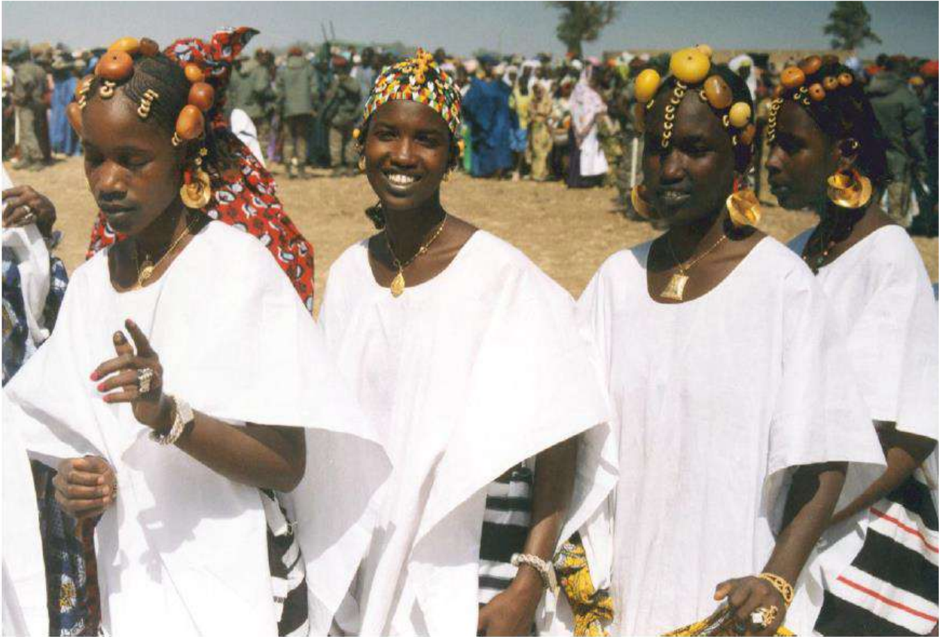
Figure 4: HinbErE , danse féminine, Yaaral Diafarabé