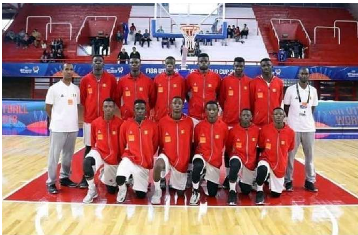
Figure 12: Afro Basket U17, Egypte 2018