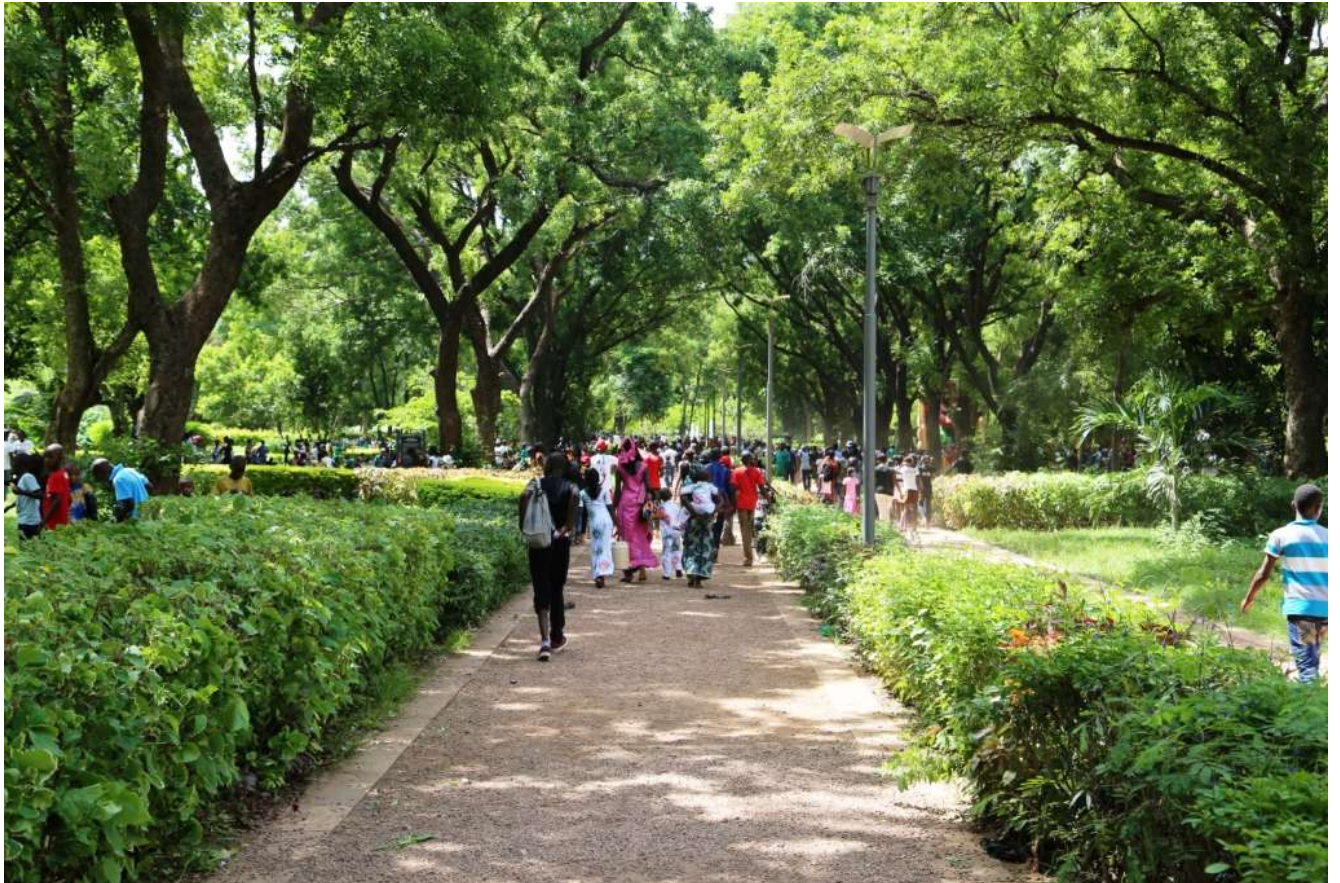
Figure 8: Parc National du Mali