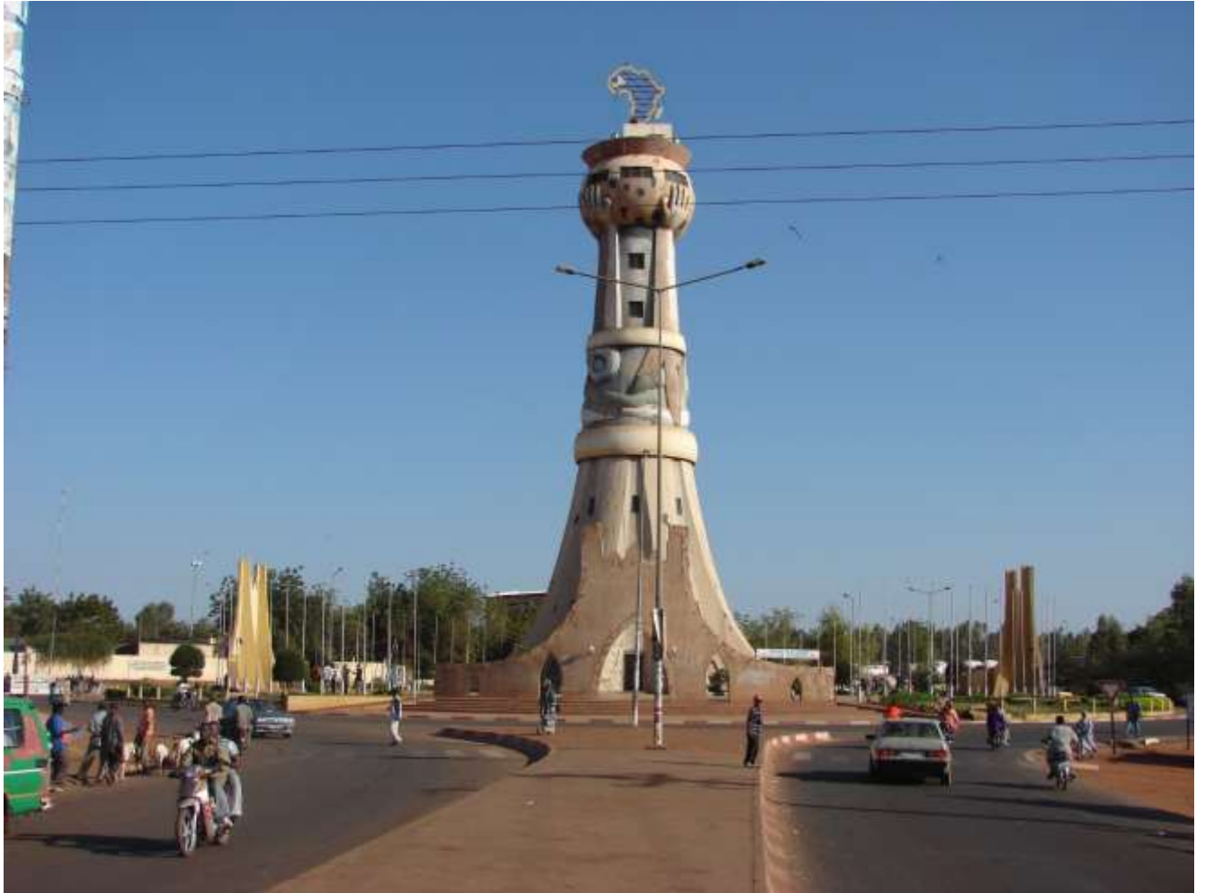
Figure 14: Tour de l'Afrique