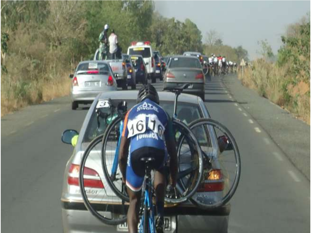
Figure 11: Tournoi du Mali 2018