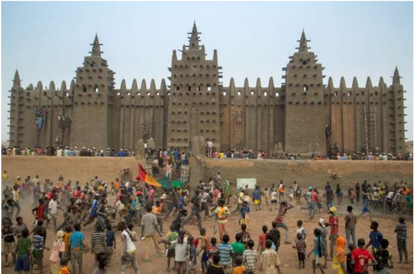
Figure 13: Crépissage de la grande mosquée de Djenné