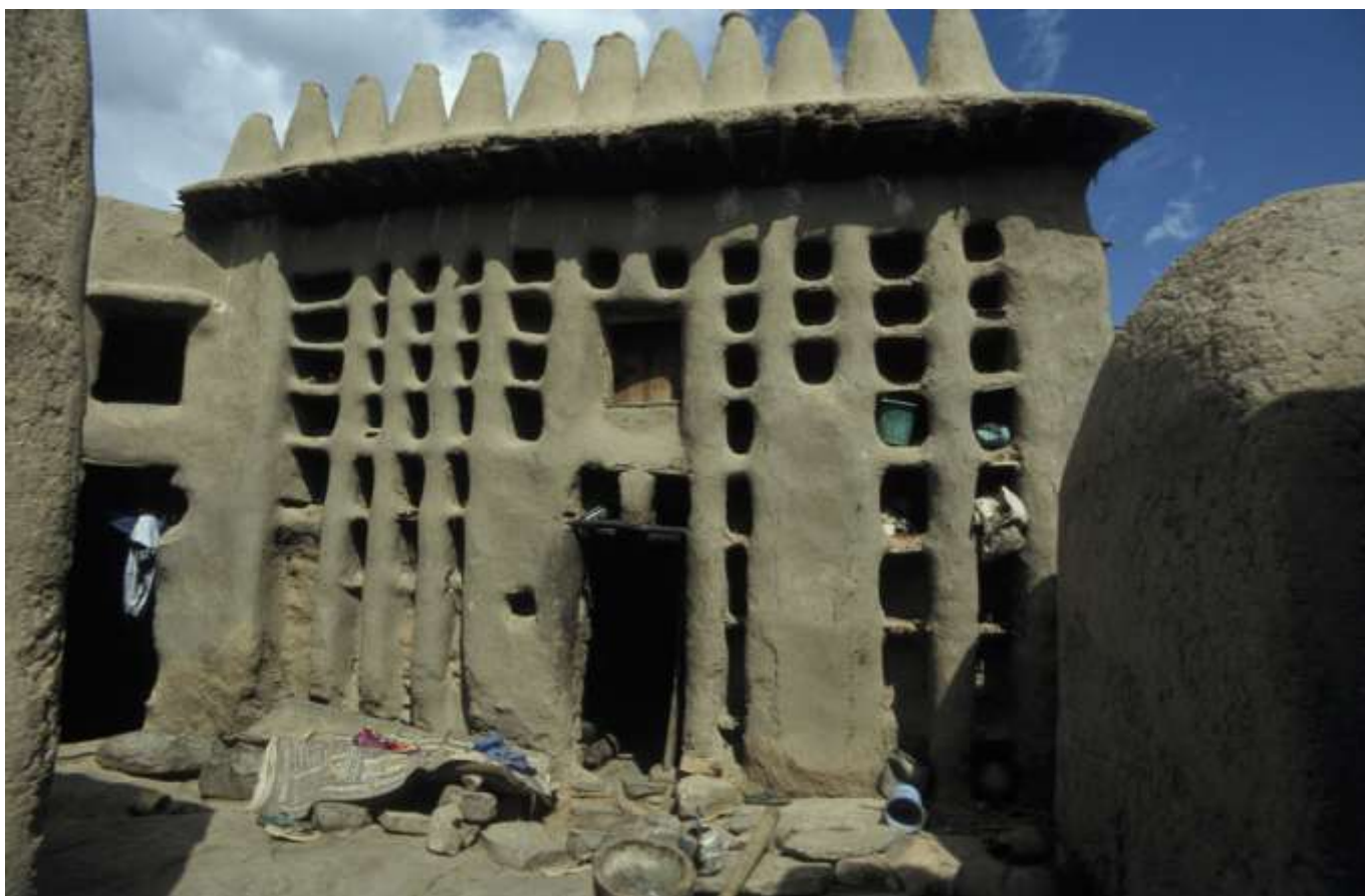
Figure 7: Gin'na à Sangha